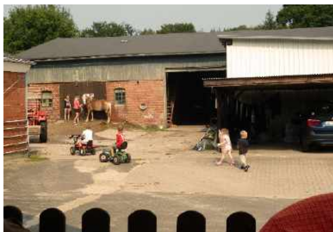
„Ferien auf dem Bauernhof“

Mittlerweile ist es heiß und drückend geworden. Die Vermieterin zeigt mir meine Ferienwohnung, eines von vier Betten kann ich mir aussuchen. Es gibt eine Terrasse und hier lasse ich mich nieder. Nebenan sitzt der Jungbauer und trinkt sein Feierabendbier, er bietet mir eins an was ich gern annehme und somit habe ich auch Feierabend!