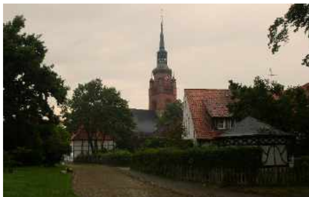
Itzehoe, Klosteranlage und St. Laurentii-Kirche

Auf der Einfallstraße überrascht mich ein Wolkenbruch! In einem Supermarkt kann ich gerade noch dem Schlimmsten entgehen. Mit mir stehen mehrere Menschen im Eingang und sehen sich die sintflutartigen Wasserströme auf den Straßen an. Es dauert eine Weile bis ein normaler Landregen einsetzt und ich meinen Weg fortsetzen kann. Am Kloster angekommen ist der Regen vorbei.