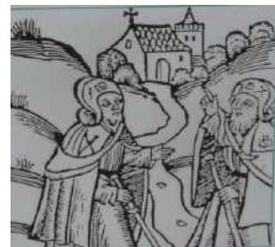
„In Gottes Namen fahren wir“ Bitten, Danken oder Buße tun..

Durch viele historische Informationen Unterwegs, bin ich manchmal auf meinem Weg „durch eine andere Zeit“ gelaufen.