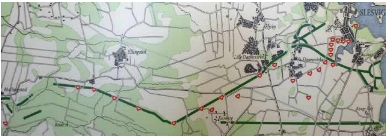
Wallanlage von Haithabu bis Hollingstedt:

Durch einen Vorort erreiche ich den „Margarethenwall“. Dieser Wall kommt von Haithabu und endet in dem Ort Dannewerk. Von hier geht er als „Hauptwall“ mit der „Waldemarsmauer“ weiter, wird dann zum „Krummwall“ und endet bei Hollingstedt. Ab hier haben die Niederungen und Moore der Eider und Treene die Schutzfunktion bis zur Nordsee übernommen.