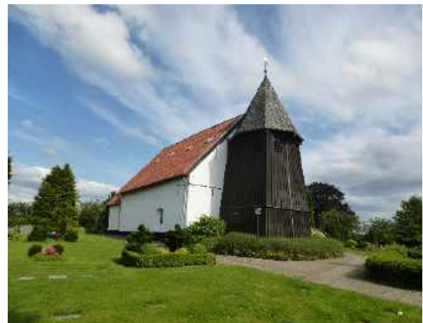
Sieverstedt, St. Petri-Kirche

Über Süderschmedeby geht es nach Sieverstedt. Hier will ich im Gemeindehaus der St. Petri Gemeinde übernachten. Ich rufe die Pfarrsekretärin an, sie gibt mir die Schlüssel für Gemeindehaus und Kirche. „Die Kirche ist ab 17 Uhr abgeschlossen und Einkaufsmöglichkeiten gibt es im Ort auch nicht, ich sollte es doch mal im Freibad versuchen“ sagte sie mir. Ich mache einen Spaziergang durch den Ort. In der St. Petri-Kirche, ein Feldsteinbau aus dem 10. Jh. mit einem Holzturm, komme ich erst einmal zur Ruhe, es war ein anstrengender Tag. Der Kamin neben dem Altar überrascht mich doch sehr.