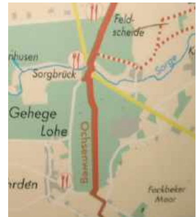
Hof Feldscheide - Furt in Sorgbrück - Fockbeker Moor

Diese Merkmale treffen auch für die Via Jutlandica zu, zahlreiche Zeugen der Vergangenheit habe ich auf dieser Tour entdeckt.