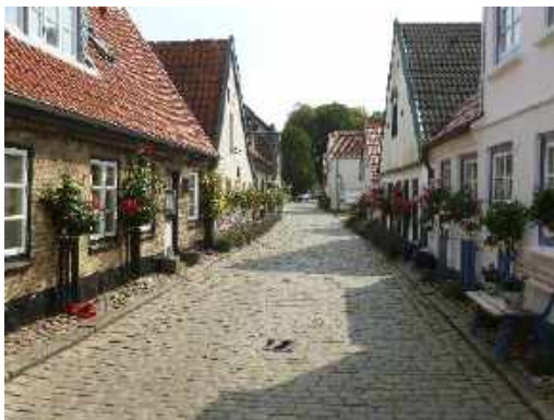
Straße im alten Hafenviertel (Holm)

zum Dom gehört und 1315 aus Backsteinen erbaut wurde. Zurzeit ist hier eine Kunstausstellung mit Holzplastiken, die alten Fresken an den Wänden bieten einen wirkungsvollen Hintergrund. Durch das Petriportal, einem Rundbogenportal mit Säulen und Würfelkapitellen von 1180, verlasse ich den Dom und gehe zum Holm.