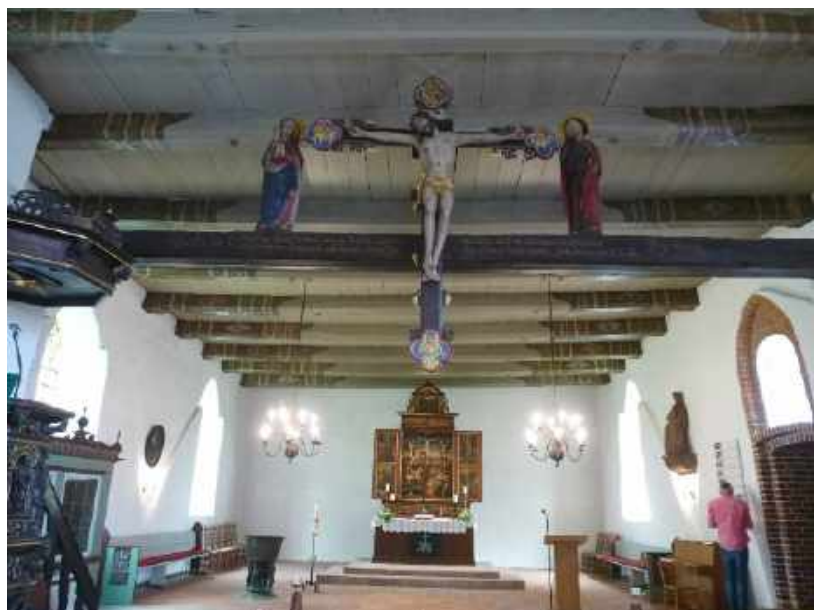
St. Marien-Kirche, Kirchenschiff mit Triumphgruppe von 1598

Über eine Klappbrücke geht es über die Stör. Die Stör ist mit hohen Deichen eingedeicht. Das lädt natürlich ein, hier drauf entlangzugehen. Ich bin nicht allein, mehrere Schafherden finden es auch sehr schön auf der Deichkrone. Wir arrangieren uns gut und sie halten auch still wenn ich ein Foto mache. Ihre Hinterlassenschaft, nasses Gras und Matsch machen meine Schuhe reichlich schwer.