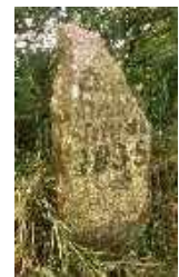
Wegestein von 1835

Es gibt viele Jakobswege in Europa, sie kommen aus allen Ländern. Die Pilgerwege folgen im Allgemeinen alten Fußwegen die sich zu Handelswegen entwickelten. Diese Wege wurden im Laufe der Zeit gut „ausgebaut“. Es gab Markierungen, so genannte Prellsteine, die die Straße begrenzten und sie gleichzeitig kennzeichneten.