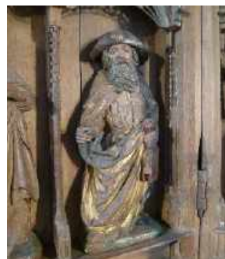
Hl. St. Jakobus d.Ä.