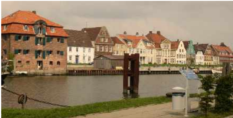
Glückstadt: Alter Hafen mit Salzspeicher von 1827

Die Türme des Fähranlegers Wischhafen sind von weitem schon zu sehen. Hier führt der Pilgerweg über die Elbe nach Wischhafen. Er geht dann weiter über Stade nach Harsefeld und mündet hier in den Baltisch-Rheinischen Pilgerweg, der „Via Baltica“.