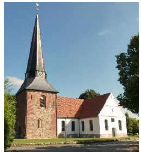
Jevenstedt, St. Georg

Weiter geht es auf dem Historischen Weg durch ein Waldgebiet. Die umliegenden Gemeinden haben an vielen Abschnitten des Weges