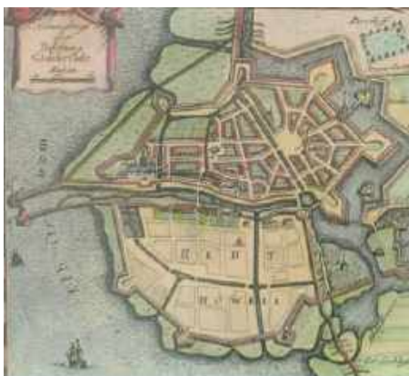
„Grundriß der Vehrung Glückstadt“

Die Stadt ist, einzigartig in Norddeutschland, als polygonale Radialstadt erbaut worden. Vom Markt aus gehen 7 Radialstraßen zu den Bastionen und Wallabschnitten der ehem. Festungs-