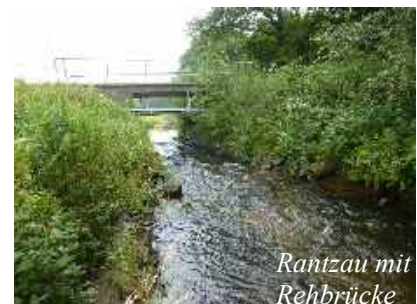
Rantzau mit Rehbrücke

Beschwingt laufe ich weiter und komme zum Naturschutzgebiet der Rantzau. Ehemals war dieses Gebiet Militärgelände der Finnischen Jäger des „Königlich Preußischen Jägerbattalion 27“. An der Rehbrücke ist Pause angesagt und ich esse meine Pilgerschnitte.