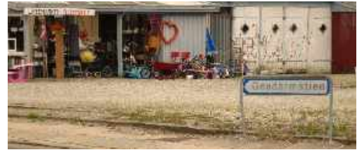
Der Gendarmenstien beginnt am Flohmarkt

Heute geht es los, zum Glück nur 17 km, die richtige Entfernung zum eingewöhnen. Der Himmel ist an diesem Morgen grau und es ist kühl aber es regnet nicht. Zuerst muss ich aber mit dem Stadtbus nach Krusau (DK) fahren, gleich hinter der Grenze ist die Endstation.