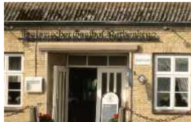
Historischer Gasthof Rothenkrug