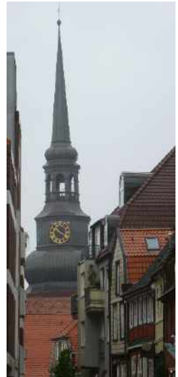
Stade St. Cosmae-Kirche