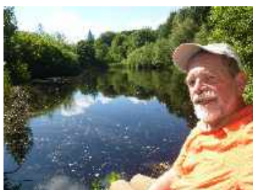
Verweilen am Weiler

Ich gehe halb um den See herum, dann geht's wieder bergauf auf 48 Meter. Unterwegs komme ich zu einem kleinen See. Hier schwirren Libellen übers Wasser. Im Wasser spiegeln sich das Ufer und der blaue Himmel wieder. Spontan setze ich mich an das Ufer und danke Gott für diese Sekunde, den Morgen und die vergangenen Tage. Besinnung und Entspannung ist angesagt und verweile lange Zeit an diesem Weiler.