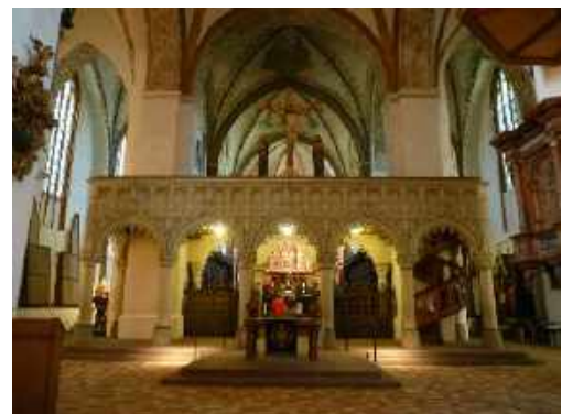
St. Petri-Dom: (re) spätgotischer Lettner mit Gemeindealtar (mi) Bordscholmer Altar (li) westliches Langhaus mit Orgel