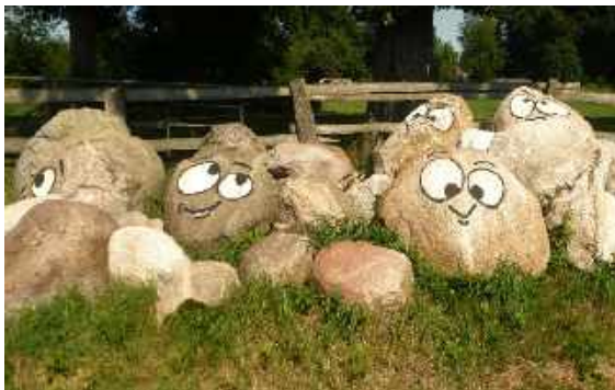
Wenn Findlinge erzählen könnten!

Die hügelige Landschaft erstreckt sich weiter bis Hohenweststedt, ich sehe den Kirchturm - dann ist er wieder ver-