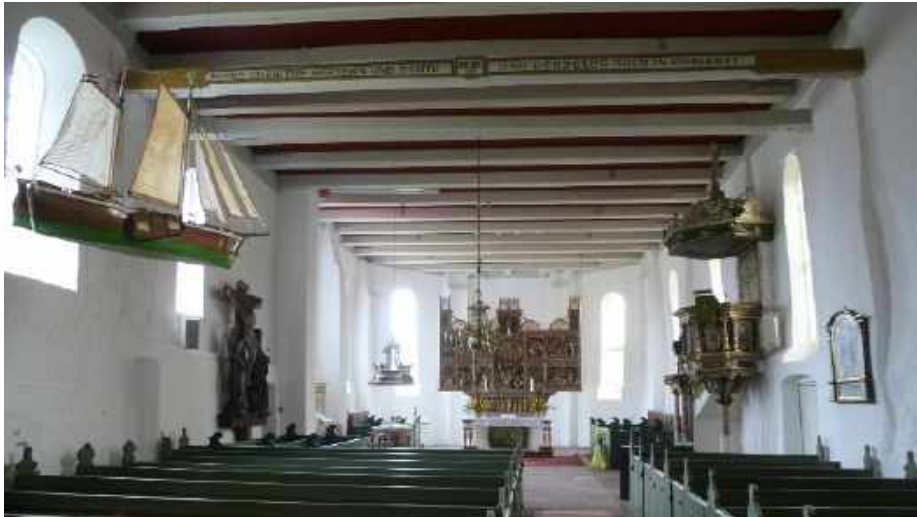
Asseln: Blick in das Kirchenschiff

Der nächste größere Ort ist Drochtersen. An der Straße stehen Obststände zur Selbstbedienung. Die St. Johannes / St. Catharina-Kirche ist geschlossen, schade, es wäre schön sich einmal unterzustellen.