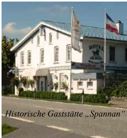
Historische Gaststätte „Spannan“

Der Weg geht über flaches Land mit einer guten Weitsicht. An der Bundesstr.77 liegt bezeichnender Weise das Historische