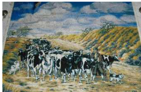
Sandüne und Redder

Für mich ist dieser Teil des Ochsen-, Heer- und Pilgerweges ein beeindruckender Abschnitt!