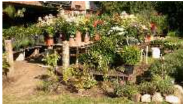
blumige Begrüßung in Jevenstedt

Das Frühstück ist super und seine Hilfsbereitschaft noch besser. Ich habe heute das Problem über 30 km laufen zu müssen. Er hat eine Lösung, er fährt mich 10 km bis nach Jevenstedt und so habe ich eine Strecke von 25 km bis Hohenweststedt, die ich wohl schaffen werde.