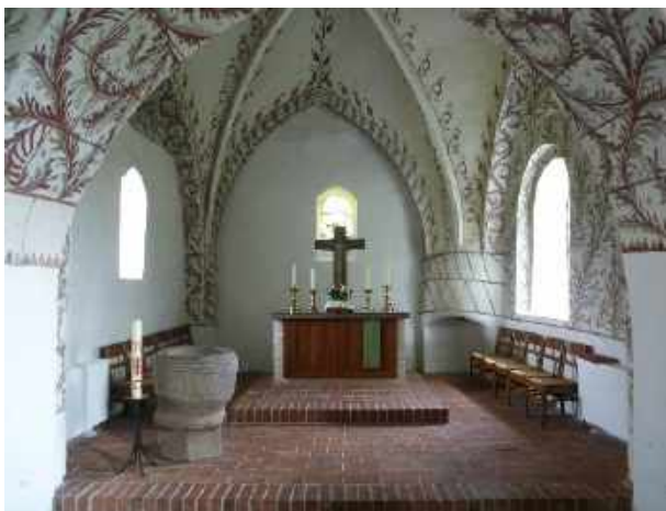
Sieverstedt, St. Petri-Kirche Altar mit Kamin

Dann kommt das leibliche Wohl zu seinem Recht, im Freibad gibt es Currywurst mit Pommes!