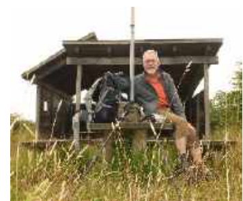
Typischer Rastplatz auf dem Ochsenweg

In meiner Unterkunft kann ich die Sachen trocknen die von heute morgen noch nass waren.