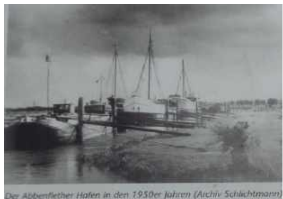
Der Abbenflether Hafen in den 1950er Jahren

In Abbenfleth zeugt noch ein altes Hafen-Deichtor von vergangenen Zeiten, als der Orte noch einen Zugang zur Elbe hatte.