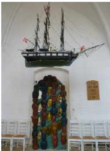
Votivschiff in Helligandskirken