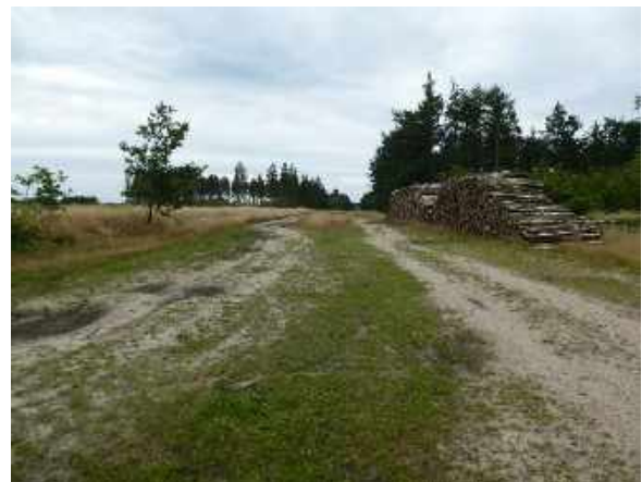
Sandwege am ehemaligen Ochsenweg

Am Ortsende steht einer der vielen „Krüge“ die für den Ochsenweg markant sind. „Du büs an Kröppersbusch noch ni vörbi“ steht hier geschrieben. Das war für Kutscher und Fuhrwerke gedacht und heißt soviel wie „auch wenn du es bis hier her geschafft hast - steht dir noch ein schwieriger Weg bevor. Sechs Kilometer geht hier der Ochsenweg schnurgerade durch den Wald. Ursprünglich war der Weg knapp 2 km breit heute verläuft er in einer Breite von 40 - 60 m. Er liegt auf einem Geestrücken, das heißt er ist sehr sandig. Manches Fuhrwerk ist eingesunken und hat Radbruch erlitten.