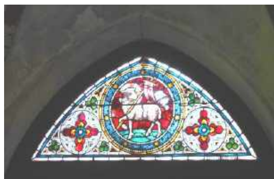
Kreuzgang, einziges erhaltene Fenster

In der St. Laurentii Kirche ist heute eine Armenische Hochzeit aber für eine Besichtigung des Kreuzganges aus dem 13 Jh. ist noch Zeit.