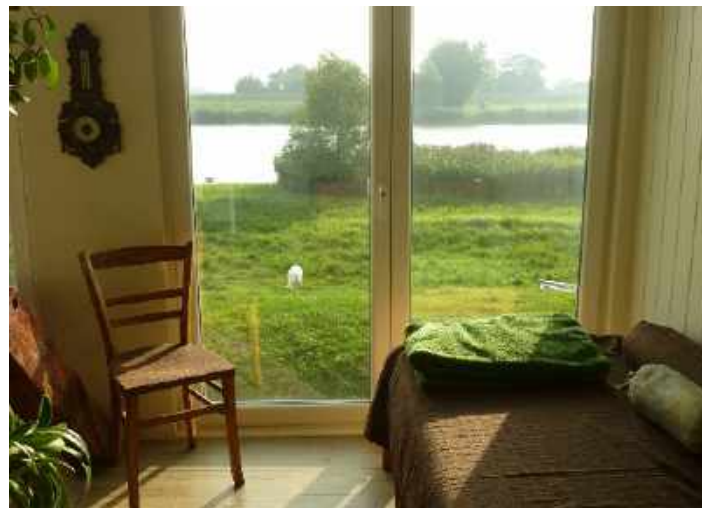
„Ferien auf dem Deich“

Gäste kamen keine mehr, glaub ich, bin leider sehr früh eingeschlafen und habe um 22.00 Uhr die Tür zugemacht!