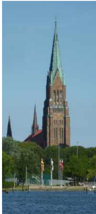
Schleswig St. Petri-Dom