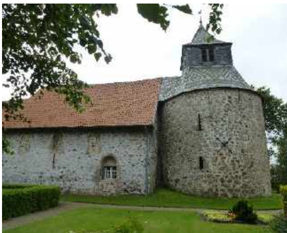
Oeversee, Wehrkirche St. Georg

An der Kirche vorbei geht's an der Landstraße weiter zum Handewitter Forst, eines der größten zusammenhängenden Waldgebiete in dieser Gegend. Hier finde ich die Jakobszeichen wieder. Es regnet langsam vor sich hin, im Wald ist es feucht, Pilze wachsen überall. Es geht über die A7 und B 200. Neue Verkehrswege haben den alten Ochsen- u. Pilgerweg durchschnitten. Zur Mittagspause gibt es ein leckeres Kuchenteilchen und ein Brötchen.