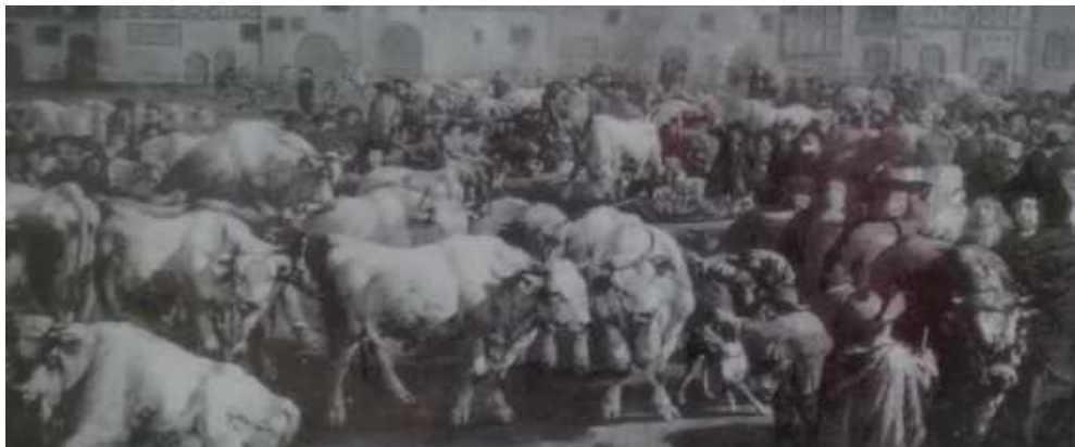
Darstellung eines mittelalterlichen Ochsenmarkt