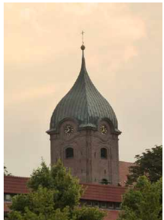
Hohenweststedt, St. Peter und Paul

und ich liege heute sehr früh im Bett. Vorher gehe ich noch zum Busfahrplan, denn morgen habe ich ein ähnliches Entfernungs-Problem wie heute und ich habe immer noch kein Bett für die nächste Nacht!