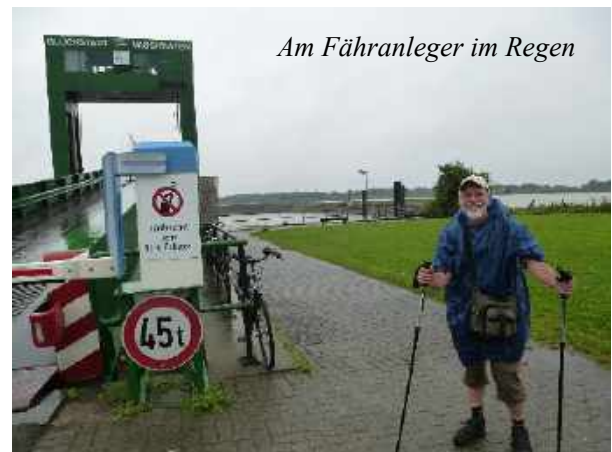
Am Fähranleger im Regen

Die Überfahrt dauert 20 Minuten, von weitem sehe ich die hochgestellte Brücke des Sperrwerks, also muss ich auf der Straße gehen! Einige hundert Meter vom Ufer komme ich zum alten und somit auch niedrigeren Elbdeich, ab hier ist der Pilgerweg wieder ausgeschildert.