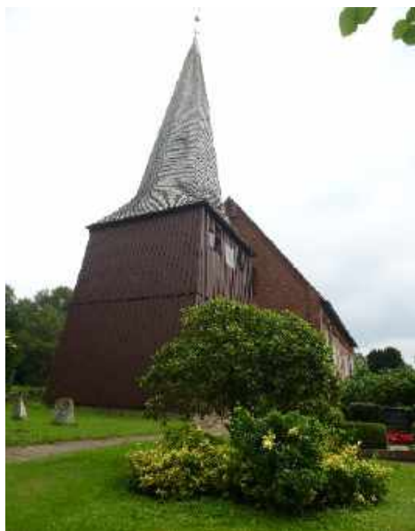
Neuenkirchen: St. Nicolai-Kirche

Glückstadt, ich habe gestern in der Jugendherberge gebucht.