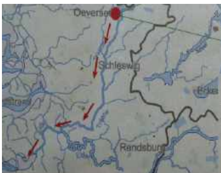
Niederungen der Eider und Treene

Die als Wehrkirche im 12. Jh. gebaute St. Georg Kirche, als Teil einer übers Land verlaufenden Wehranlage. Gleiche Anlagen findet man im Osten Englands, in dem Teil der einst zu Dänemark gehörte. Im 6. Jh. sind Bewohner Angelns hierhin ausgewandert. Vielleicht kommt daher der Name Angel-Sachsen. Die romanische Kirche hat unter anderem eine Renaissance-Kanzel aus der Ringerigk-Schule, Flensburg.