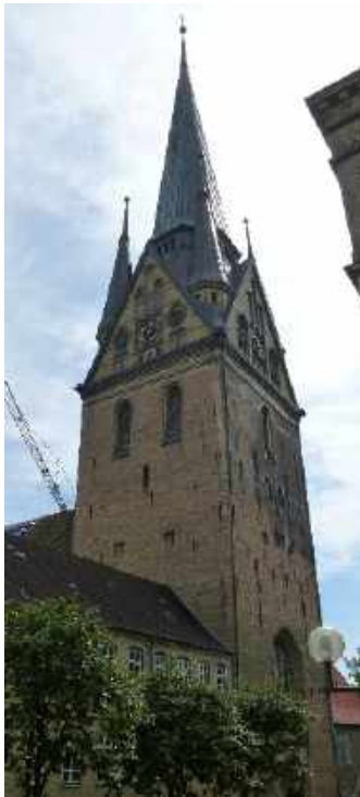
Flensburg St. Nikolai-Kirche