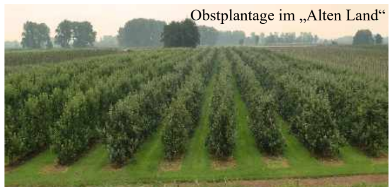
Obstplantage im „Alten Land“

Auf dem Fahrradweg neben der Landstraße gehe ich weiter. Die Jungs mit ihren Rädern überholen mich, sie mussten zwischen durch einen Reifen flicken. Es regnet mal wieder und ich ziehe die Pelerine über (dreimal an diesem Tag einmal mit Blitz und Donner).