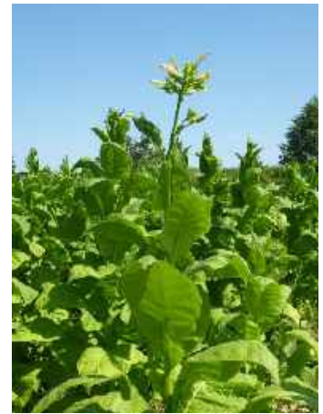
Tabakpflanzen in Schleswig-Holstein

Bevor ich nach Nindorf komme treffe ich auf eine Fahrradgruppe mit Senioren. Sie wollen dahin wo ich herkomme und ich will dahin wo sie heute gestartet sind. Wir rätseln darüber was im Feld nebenan angebaut ist und kommen zu dem Ergebnis, das es Tabak sein muss. Nindorf ist eines der Urdörfer Holsteins, Hünengräber und Bodenfunde weisen auf eine frühe Besiedlung hin.