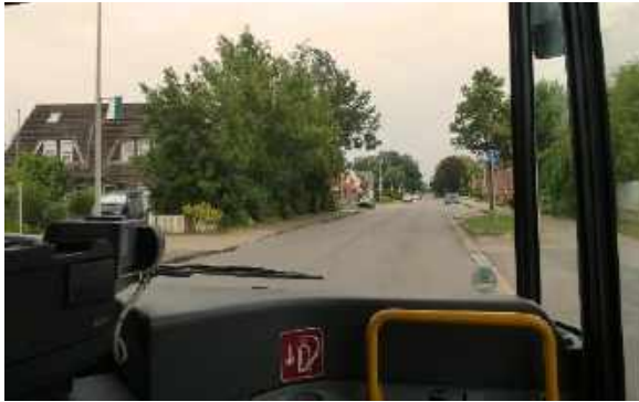
Mit dem Bus in 15Min. von Abbenfleth nach Stade

Ich überlege wie es weitergehen soll. Es ist 17 Uhr und 6 Kilometer liegen noch vor mir, meine Kondition ist am Ende. Ich bin nicht weit von der Landstraße, von dort geht eine Buslinie nach Stade.