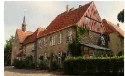
Kloster St. Johannis

Moore und Niederungen wurden umgangen. In Entfernungen von einem Tagesmarsch entstanden Herbergen u. Ausspannhöfe.