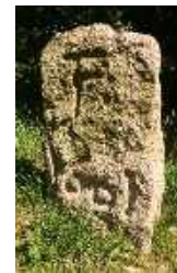
„Gränzstein“ anno 1601