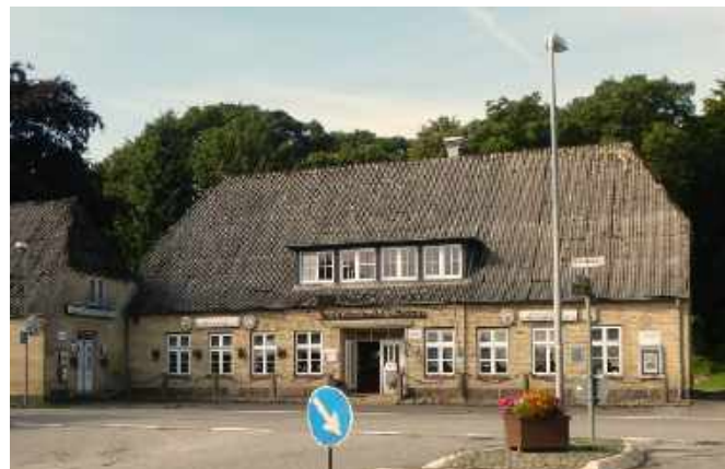
Historische Ochsenweggaststätte Rothenkrug

Ich verlasse den Ochsenweg. Am Hauptwall befindet sich ein Museum, es zeigt die Geschichte der Dänen die hier leben und zur „Südschleswiger Volksgruppe“ gehören. Der Hauptwall in diesem Abschnitt war 1850 im deutsch-dänischen Krieg zu einer Festung ausgebaut.