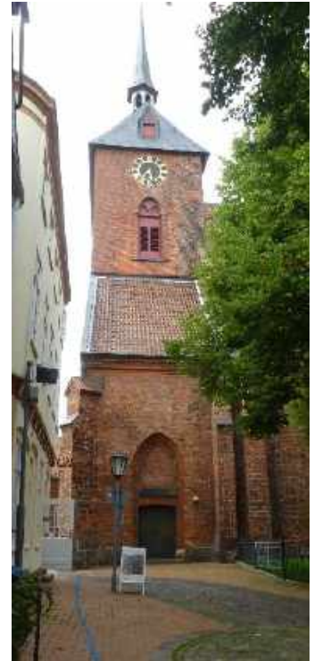
Rendsburg St. Marien-Kirche