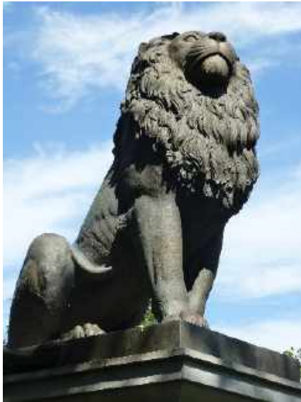
Idstedt Löwe, Sinnbild der deutsch-dänischen Krieges von 1850

Die deutsch - dänische Geschichte ist von vielen Kriegen geprägt. Erst 1920 wurde der heutige Grenzverlauf zu Dänemark mittels Volksabstimmung entschieden. Auf dem „Förde-Gebirge“, eine stark ansteigende Anhöhe am Stadtrand gibt es Museen, Denkmäler und Erinnerungs-Friedhöfe. Sehr viele dieser Einrichtungen erinnern an die wechsel- u. leidvolle Geschichte beider Länder. Auch über die geologische Beschaffenheit und letzten Eiszeit auf Jütland und Schleswig-Holstein gibt es Ausstellungen.