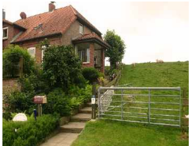
Altes Fährhaus am Deich

„Das Ziel in Sichtweite“ zog sich hin. Auf dem flachen Land kann man zwar weit sehen aber der Weg zieht sich auch. Ich komme noch früh genug am alten Fährhaus an. Hier am ehemaligen Fähranleger über die Stör wohnen Astrid und Klaus Schäpe.