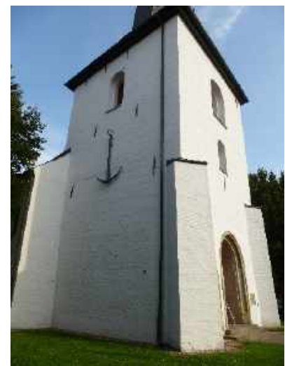
Stadtkirche mit erbeutetem Anker der „Hamburger Seeflotte“

Der dänische König Christian der IV ließ 1615 die Stadt als Festungsstadt erbauen. Sie sollte der aufstrebende Hafenstadt Hamburg den Rang ablaufen. Leider hat sie schlechte Voraussetzungen dafür, die geringe Wassertiefe und eine vorgelagerte Insel machen diesem Vorhaben ein Ende. Lediglich die Erbeutung eines Ankers des Flugschiffes der Hamburger Seeflotte war dem ehrgeizigen König vergönnt. Seit 1630 ist dieser Anker im Kirchturm eingelassen.