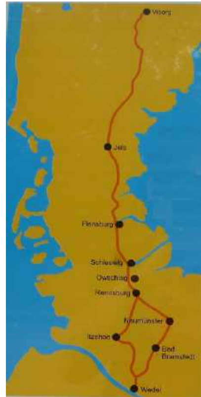
Der Ochsenweg von Viborg in Dänemark bis Wedel an der Elbe

In erster Linie war er aber Handels- und Herdenweg, auf dem Kaufleute und Händler in die Städte des Südens zogen und umgekehrt. So bekam er auch den Namen Ochsenweg. Einerseits führen die ersten Händler mit Ochsenwagen und andererseits wurden auf diesem Weg von Jütland bis vor die Tore Hamburgs, nach Wedel, Ochsenherden getrieben. Seit dem Mittelalter sind Millionen von Tiere auf diesem Weg in die Ballungszentren des Südens gekommen. Im Jahre 1651-52 wurden 15.860 Ochsen „verzollt“!