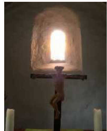
Altar St. Georg

Eine alte Frau zeigt mir den Weg zur Kirche. „Ich solle sie aber nicht mitnehmen, es sei ihre Kirche“ meinte sie.