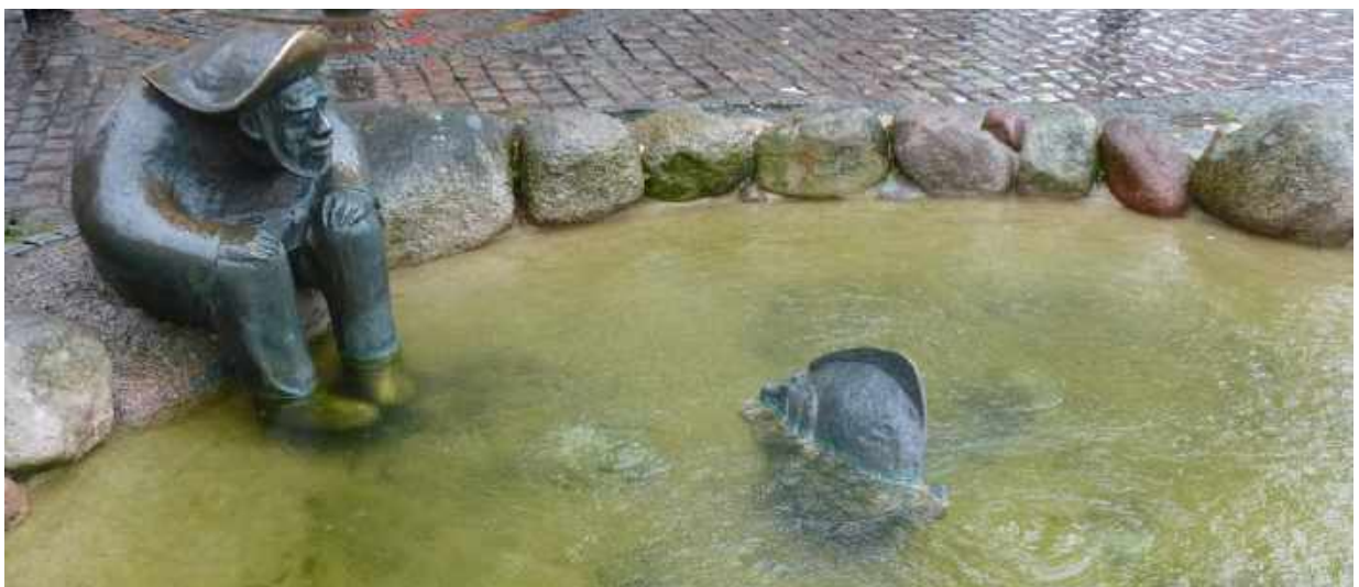
Stade am alten Fischmarkt: Wiedersehen mit dem „Fischer un sin Butt“ im nächsten Jahr?