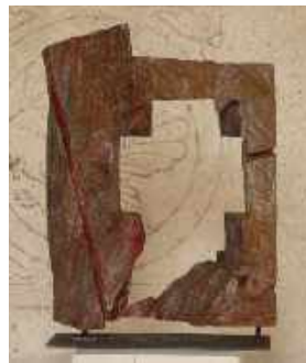
Holzobjekte vor Freskenwand

Jetzt gehe ich erst einmal durch den Schwahl, das ist der Kreuzgang der