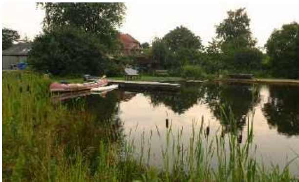
Ein „Teich“ mit den Ausmaßen eines Badesees

Muss mich aber noch einen Augenblick gedulden, sie scheren gerade ein Mutterschaf. Endlich kann ich meinen Rucksack ablegen. Es ist wieder warm geworden, der richtige Augenblick für ein erfrischendes Bad im Teich. Von einem großen Teich hatte mir der Pastor schon erzählt, jetzt sehe ich die Ausmaße mit eigenen Augen, der Teich hat eine Fläche von 5.000 Quadratmetern!