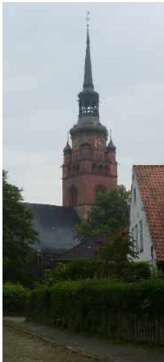
Itzehoe St. Laurentii-Kirche