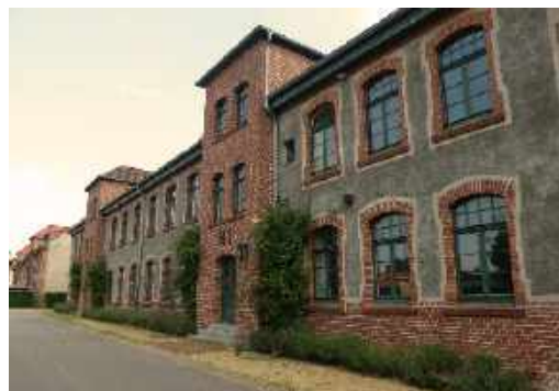
Manschaftskaserne der finnischen Jäger „Soumalaisten jääkärien majoituspaikka“

Nach Hohenlockstedt zu gehen ist ein Umweg aber ich habe noch Zeit für diesen Abstecher. Auffällig ist, dass es im Ort eine „Finnische Allee“ und ein Finnisches Ehrenmal gibt. Mein Pilgerführer weist davon nichts Genaues zu berichten. Beim Ehrenmal finde ich die Erklärung. In den Jahren 1915 bis 1918 wurden hier finnische Soldaten ausgebildet, die wesentlich dazu beitrugen, ihre Unabhängigkeit zu erkämpfen. Heute noch kommen Finnen zu Gedenktagen nach Hohenlockstedt.