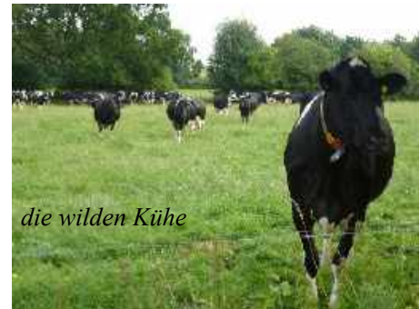
die wilden Kühe

Heute am Freitag fährt der Bus aber nicht nach Peissen sondern hält an der Bundesstraße! Ein kleiner Schreck, aber egal, die Richtung stimmt. Der Busfahrer sagt mir Bescheid und kurz darauf stehe ich auf der Straße an einer Kreuzung. Von weitem sehe ich schon mein Zeichen und bin sofort auf dem richtigen Weg. Der Himmel ist mit Wolken verhangen und es fängt an zu regnen. Eine Kuh-erde kommt auf mich zu gerannt, biegt kurz vorm Zaun ab