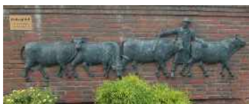
Kunstobjekt am Ochsenweg