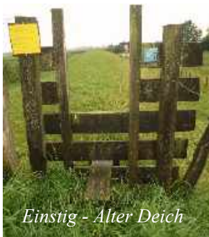
Einstig - Alter Deich

Die Deichkrone, eher ein Deichkrönchen, ist mit hohem Gras bewachsen, es gibt keine Schafe die es kurz halten. Der Weg ist uneben, Mäuse haben die Oberfläche durchlöchert und das Gras ist nass. Eigentlich ist es ein schöner Weg, man sieht die riesigen Obstfelder die sich bis zur fernen Elbe hinstrecken. Es ist das „Alte Land“. Nachdem ich beinahe meinen Fuß im Mäusegang umgeknickt habe, verlasse ich bei der nächsten Gelegenheit diesen „Acker“.